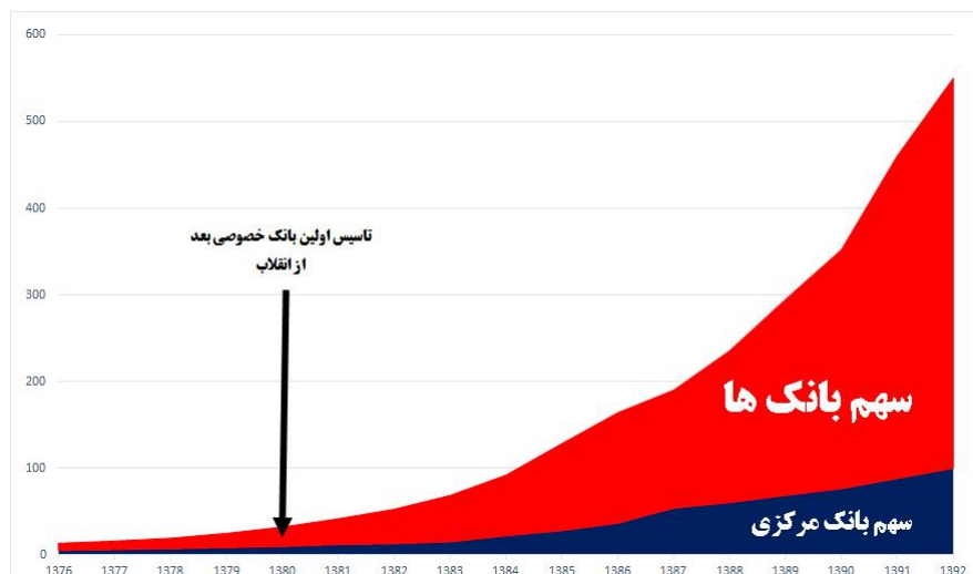
مقایسه سهم بانک‌ها و بانک مرکزی در نقدینگی

اما خلق پول توسط بانک‌ها یا همان ضریب فزاینده چیست؟ در این روش بانک مرکزی با تغییر میزان سپرده قانونی بانک‌ها، اجازه اعطای تسهیلات و به طبع آن اجازه خلق پول را به بانک‌های عامل می‌دهد، در حال حاضر نزدیک به ۴۵۰ هزار میلیارد تومان از کل نقدینگی ۵۶۰ هزار میلیارد تومانی با این روش خلق شده است (۵۰۴۱۶).